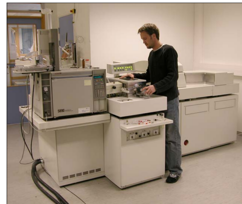
Wysokorozdzielczy spektrometr masowy do wykrywania ilości femtogramowych.

NILU posiada autoryzację WHO w zakresie analizy dioksyn w mleku krowim, mleku ludzkim oraz rybach. Według naszej wiedzy NILU jest pierwszym europejskim laboratorium dioksyn, które uzyskało akredytację zgodnie z EN-17025.